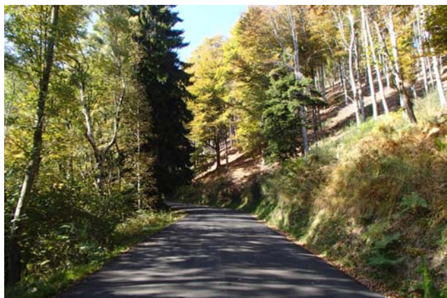
salita lungo la strada immersa nel bosco

Una salita da veri intenditori, ...tutta da amare o tutta da odiare...dalla quale, una volta giunti al traguardo, non si potrà restare che inebriati di soddisfazione per la grande impresa compiuta!!!