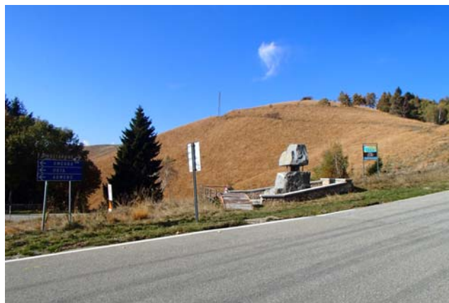
in vista dell'arrivo!