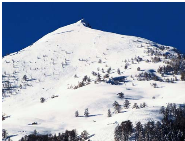
Panoramica del Monte Rosetta

La posizione della sua Cima, posta all’inizio della Val Gerola, la trasforma in un balcone affacciato a nord sulle Alpi Retiche e a sud sulle Alpi Orobie.