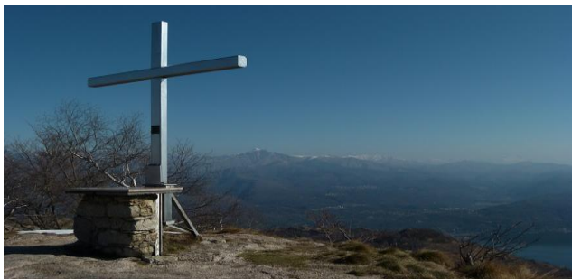
Vetta Monte Zughero

ITINERARIO. Parcheggiate le auto nella località Tranquilla di Baveno (m 232), ci si incammina per il sentiero M3, che sale nel bosco, ripido e senza mai 'mollare', fino alla vetta del Monte Camoscio (m 890 – h 1.45), nei cui pressi sorge il Rifugio 'Papà Amilcare' dell'ANA di Baveno. Si segue poi, verso sud, la cresta che passa dal Monte Crocino (m 1023) e scende all' Alpe Vedabbia (m 879 – h 0.45 / 2.30). Resta l'ultimo strappo per la vetta dello Zughero (m 1230 – h 1.00 / 3.30). Per la discesa si ritorna all' Alpe Vedabbia , indi con i sentieri M2 e M9, alla Tranquilla di Baveno . Dislivello: m 1142 – Esposizione: est – Difficoltà: facile (E).