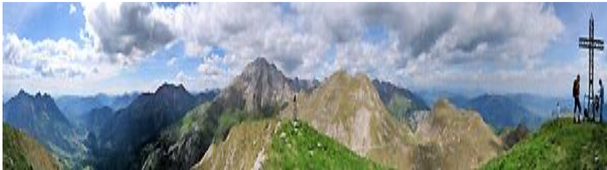
Panoramica 360° da Cima Grem (2049 m.)